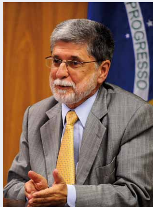
Embaixador Celso Amorim / Ambassadeur Celso Amorim

O sacrifício daqueles que acreditavam em um Haiti melhor e a coragem e dignidade dos haitianos diante de uma das piores catástrofes humanitárias da história revigoram nossa determinação