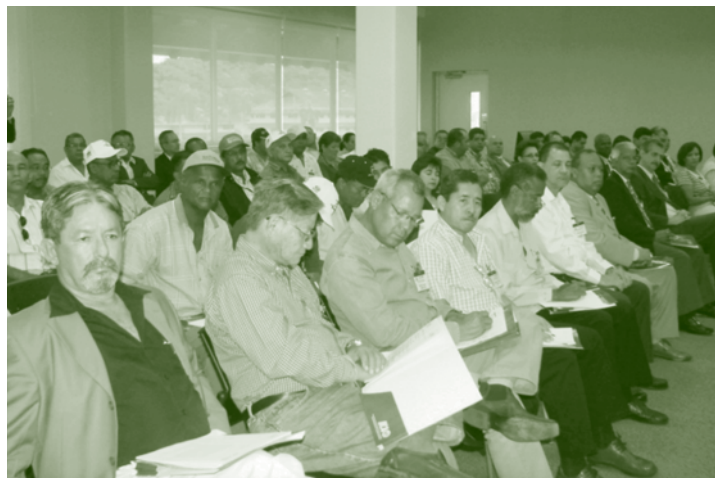
Reunión de Validación del Plan de Acción de Arroz con actores de la cadena.

enfoque de cadenas agroalimentarias. Este enfoque se ha insertado en el contexto social y económico del país, donde todos los eslabones que componen las cadenas (lácteos, arroz, maíz - sorgo, frutas) dialogan en una misma mesa para conseguir la competitividad de la cadena, a través de la implementación de los acuerdos de competitividad (plan de acción) bajo la responsabilidad del comité de cadenas. En el caso de la cadena de arroz, se ha logrado incluir por primera vez la participación de los pequeños productores que utilizan el sistema de producción tradicional a chuzo , y a las pequeñas industrias, como es el caso de las piladoras.