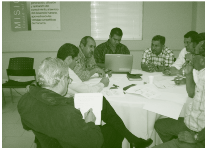
Grupo de trabajo en el Taller Estrategia de Implementación del Sistema de Extensión Agropecuaria.