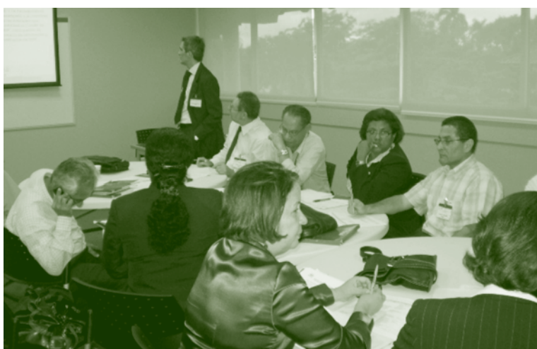
Grupo de trabajo de actores de la cadena de lácteos

que componen la cadena: productores, procesadores, comercializadores, suplidores de asistencia técnica e insumos y consumidores. Este apoyo técnico del IICA ha sido muy útil para el país y sería apropiado que se incluyera en el documento de Buenas Prácticas Institucionales (BPI).