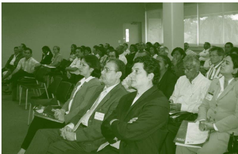
Reunión de trabajo para la validación de la Agenda Nacional de MSF.

Los resultados obtenidos a partir de la implementación de la Agenda Nacional de Cooperación Técnica y el cumplimiento de los compromisos regionales y hemisférico, no hubieran sido posibles sin la valiosa contribución y apoyo técnico directo de los especialistas regionales para Centroamérica y los especialistas hemisféricos de las áreas de comercio y agronegocios, sanidad agropecuaria e inocuidad de alimentos, desarrollo rural, y tecnología e innovación.