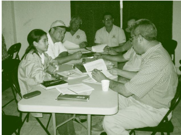
Grupo de trabajo del Taller de Validación del Frutales.