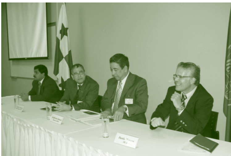
Mesa principal de la Reunión de Validación del Plan de Acción de Arroz.

En la cadena de lácteos, la aplicación del modelo de cooperación técnica del IICA permitió que se realizará un trabajo intertemático para lograr el establecimiento de un sistema de pago por calidad de la leche en Panamá, como una necesidad nacional apoyada por todos los eslabones