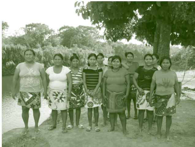
Organización La Unión de Darién, ganadoras del Concurso de Mujeres Indígenas Emprendedoras.

Durante este período, también se destaca el apoyo técnico del IICA durante el trabajo conjunto que realizó con el FIDA y el Centro de Gestión Local (CEGEL Darién) para la selección de un territorio de referencia en la región de Darién, donde se implementaría un programa de desarrollo rural sostenible con enfoque territorial y otro de un programa de turismo rural.