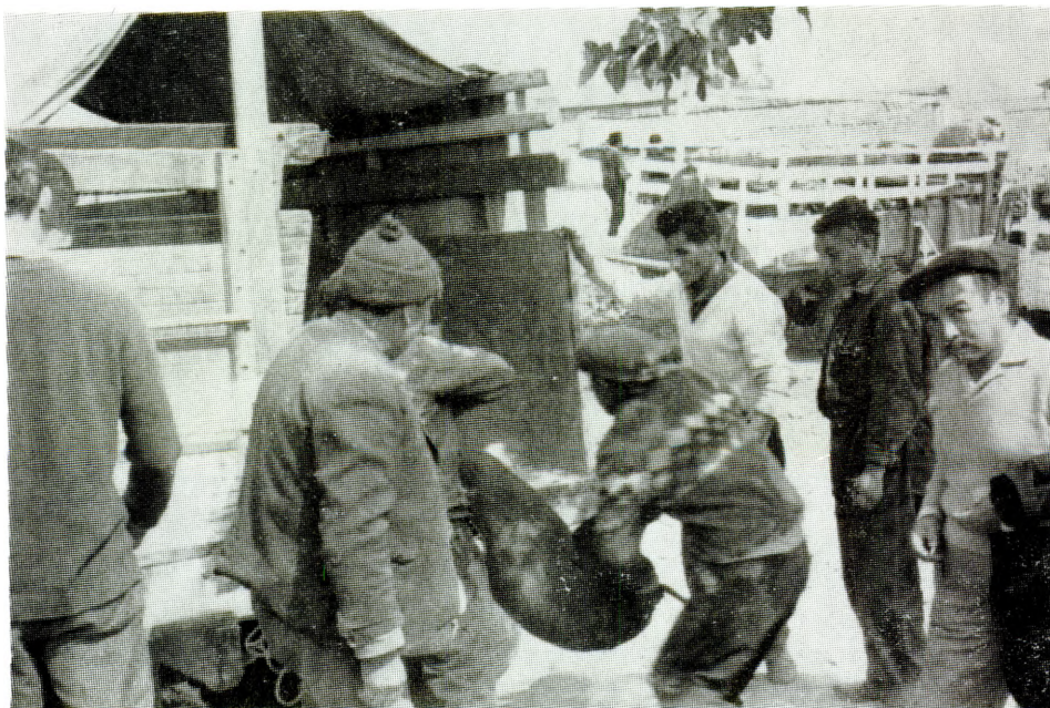
Estudios sobre la comercialización agropecuaria.

La colaboración en comercialización agropecuaria se orientó principalmente hacia tres instituciones: la Empresa Nacional del Arroz (ENA), la Dirección de Economía y Estadística del MACA, y el Ministerio de Industria, Comercio y Turismo. Así, se pudo cooperar en el estudio y formulación de un programa de compras de maíz; en la elaboración de las bases para un plan de comercialización de maíz duro; en el análisis de los programas de comercialización del arroz; en la revisión y publicación de estadísticas de los últimos 10 años; en ofrecer metodologías sobre Centros de Acopio y Mercados Mayoristas; y, en la capacitación en servicio en Perú de especialistas nacionales.