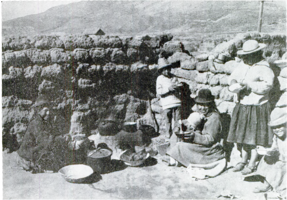
Análisis de la estructura de las comunidades del Desaguadero

Es así que en el Departamento de Oruro, se inició un análisis de la estructura orgánica de las comunidades del área del Desaguadero. Para ello se logró información de 24 comunidades, que son en su mayoría parte representativa del área total de las 3 provincias involucradas.