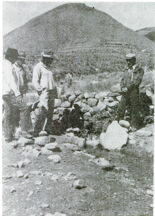
Acciones de apoyo para la transfe- rencia de tecnología agropecuaria.