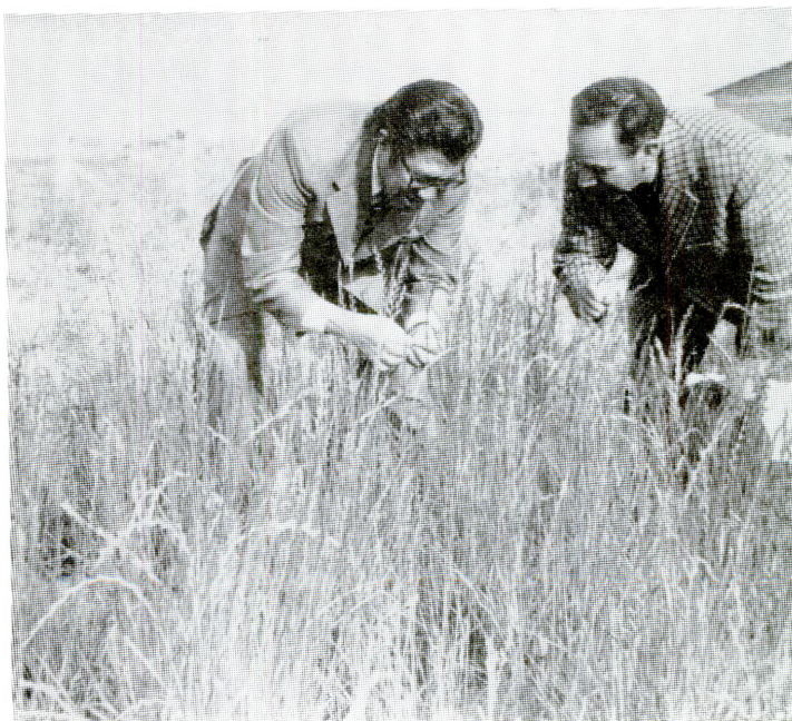
Evaluación de la fenología de pastos en Andes Altos.

Asimismo, el Instituto colaboró con el Servicio de Recursos Naturales Renovables, en la iniciación de algunos proyectos de investigación forestal, tanto en la parte metodológica como en el suministro de semillas certificadas. También se analizaron y definieron prioridades y estrategias en este campo; y, se preparó un documento destinado a servir de base para la elaboración de un diagnóstico sobre produc-