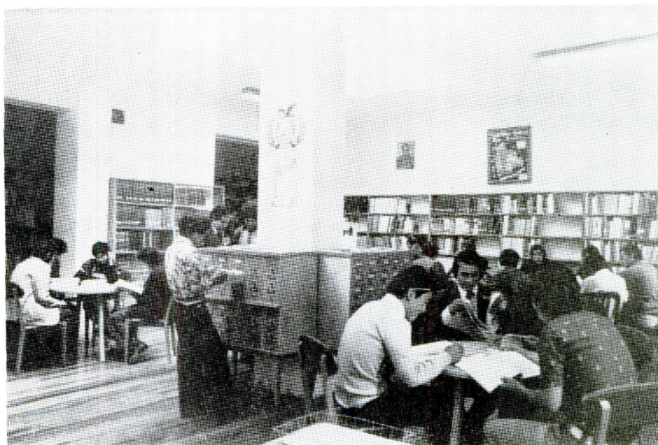
Fortalecer las bibliotecas agrícolas nacionales para un mejor servicio y su integración a Sistemas Internacionales.

Las actividades ejecutadas por el IICA en Bolivia, en esta línea de acción, fueron las siguientes: