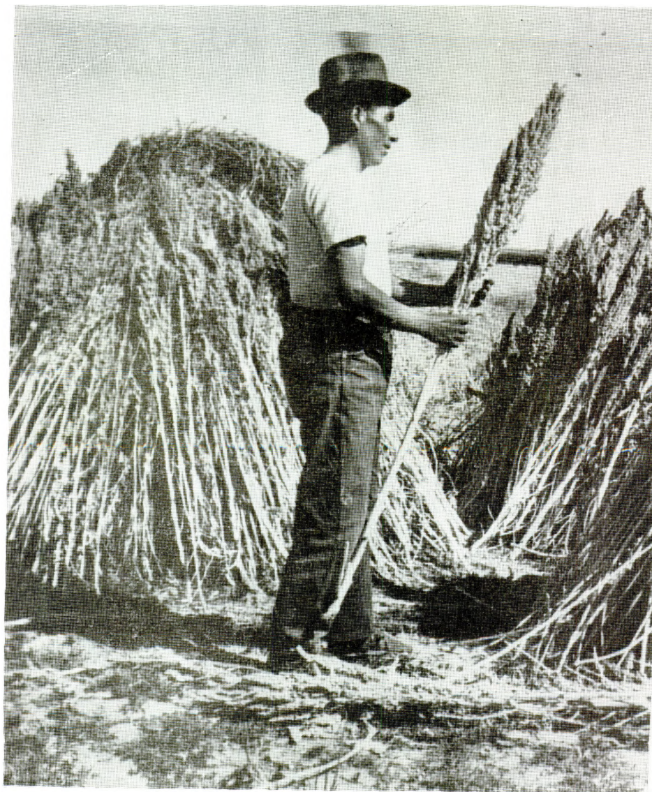
Elaboración de proyectos de quinua.

La colaboración del IICA en lo concerniente a la regionalización de la investigación en los Andes Altos bolivianos, se dirigió a tres aspectos fundamentales: al suministro de semillas de pastos exóticos y nativos, adaptables a condiciones de alturas, heladas, humedad, sequías, salinidad de los suelos y otros factores adversos, proporcionando las recomendaciones técnicas para la implantación de los semilleros