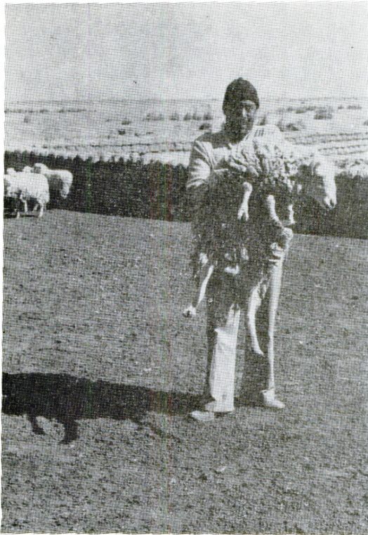
Metodologías para extensión agrícola en la zona de Oruro