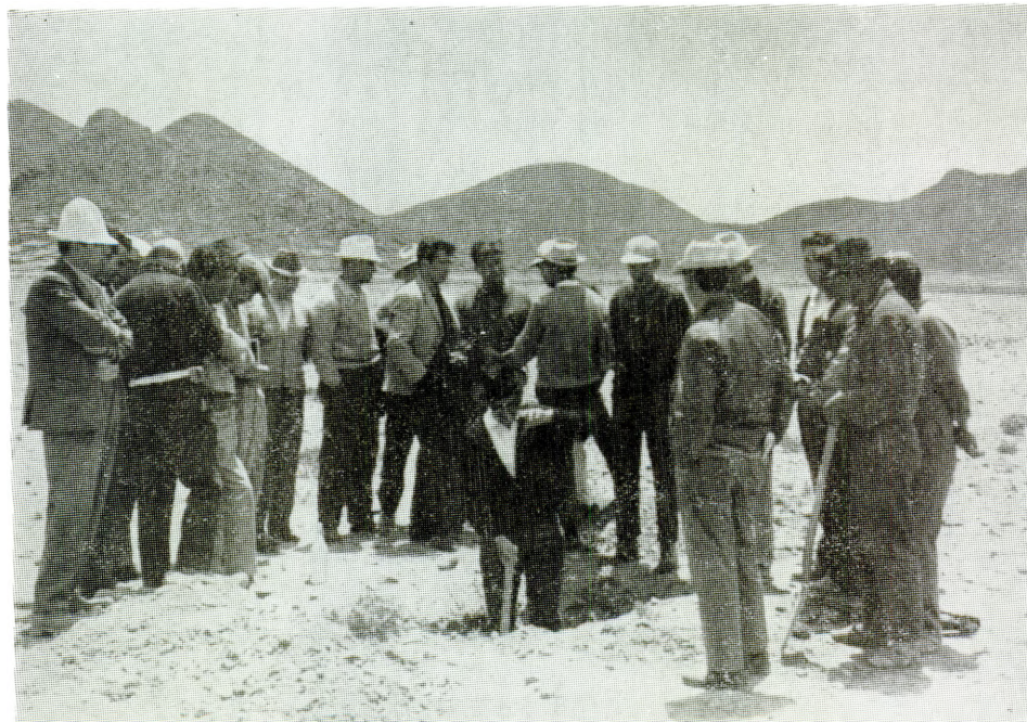
Acciones en beneficio de una política de desarrollo agrícola.

Como parte integrante de esta línea de acción del Instituto Interamericano de Ciencias Agrícolas, se ejecutaron los proyectos de fortalecimiento de organismos nacionales dedicados a la planificación agrícola, así como al fortalecimiento de la administración y gestión de las organizaciones del desarrollo del sector agrícola boliviano.