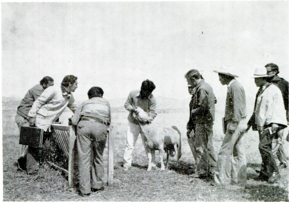
Curso de producción animal para agentes de crédito.

Para cooperar al desarrollo de la ganadería y las pasturas de Bolivia, se capacitó a personal técnico del Banco Agrícola en aspectos tecnológicos de la producción animal, incluyendo manejo de sistemas. Asimismo, técnicos bolivianos participaron en una reunión regional en el Perú, donde se analizaron los factores de la investigación y producción de leguminosas forrajeras tropicales. Finalmente, se brindó apoyo en la organización y mantenimiento del Banco de Germoplasma nacional, como parte integrante del Banco Regional, con sede en Palmira, Colombia.