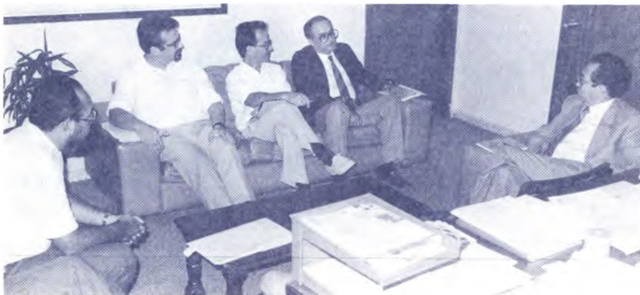
Grupo de Trabajo del Proyecto PNUD/IICA en visita al Vice-Ministro de Recursos Naturales para discutir aspectos relacionados con la formulación de dicho proyecto.

- En enero de 1987, se publicó un estudio sobre las exportaciones agrícolas no tradicionales. El trabajo intitulado "Programa de Promoción de Exportaciones Agrícolas no Tradicionales", fue preparado conjuntamente por técnicos de la Secretaría de Recursos Naturales (SRN), la Secretaría de Coordinación, Planificación y Presupuesto (SECPLAN) y el Instituto Interamericano de Cooperación para la Agricultura (IICA-Honduras).