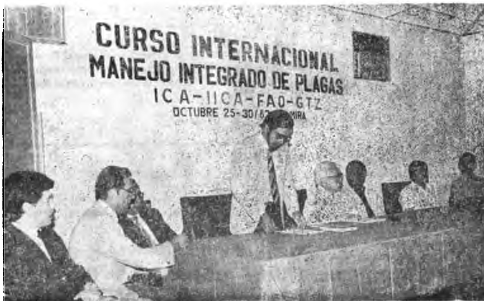
Mesa Directiva en ceremonia de Inauguración