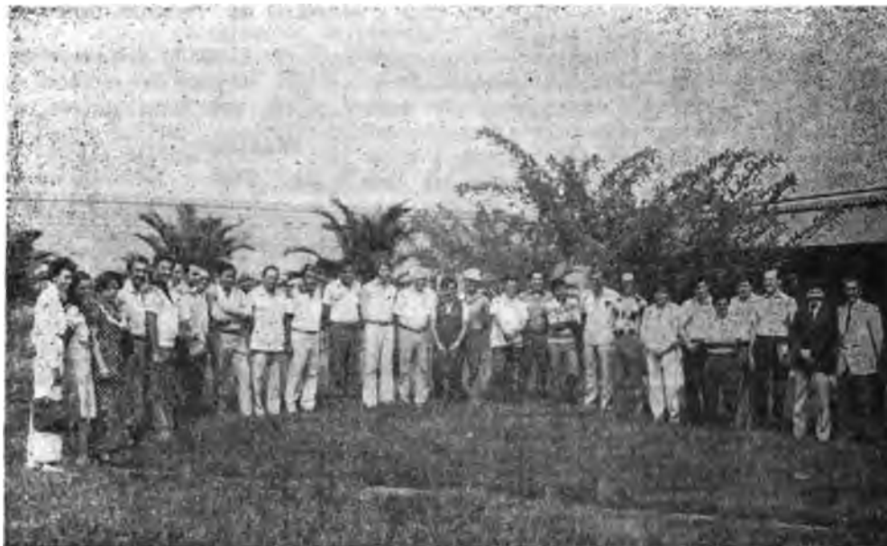
Participantes al curso Internacional de manejo integrado de plagas