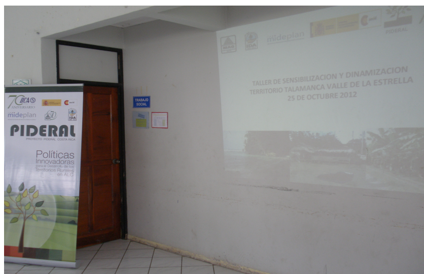
Foto 8. Banner de PIDERAL utilizado durante una de las actividades de sensibilización