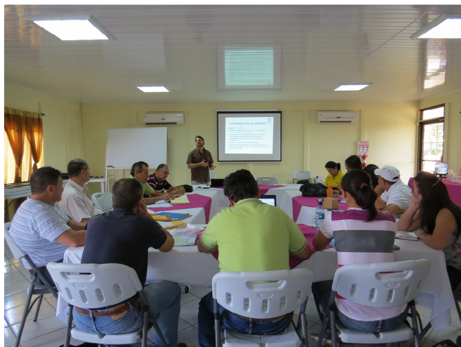
Foto 3. Sur-Sur: transferencia de buenas prácticas a los equipos del INDER