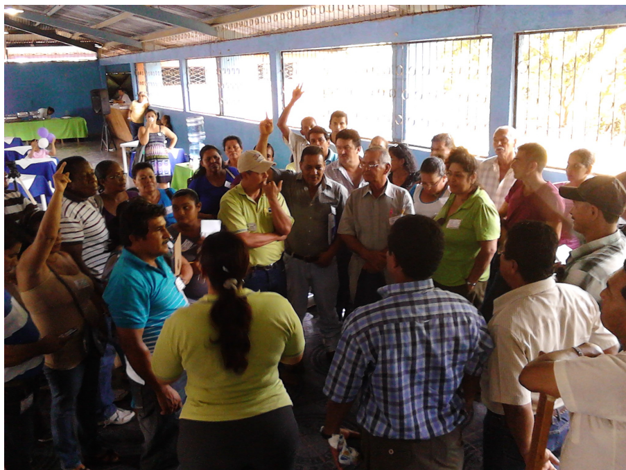
Foto 2. Tamanca-Valle de la Estrella: votaciones en la Asamblea de la OLDER