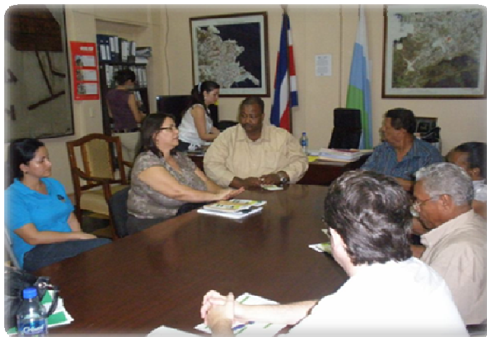
Foto 1. Talamanca-Valle de la Estrella: reunión con el alcalde de la Municipalidad de Limón

Debido a los objetivos de la ATG de PIDERAL en este territorio – que consistían en reforzar una OLDER ya existente – no se ha llevado a cabo un mapeo de otros planes estratégicos que se añaden a los elaborados por los GAT.