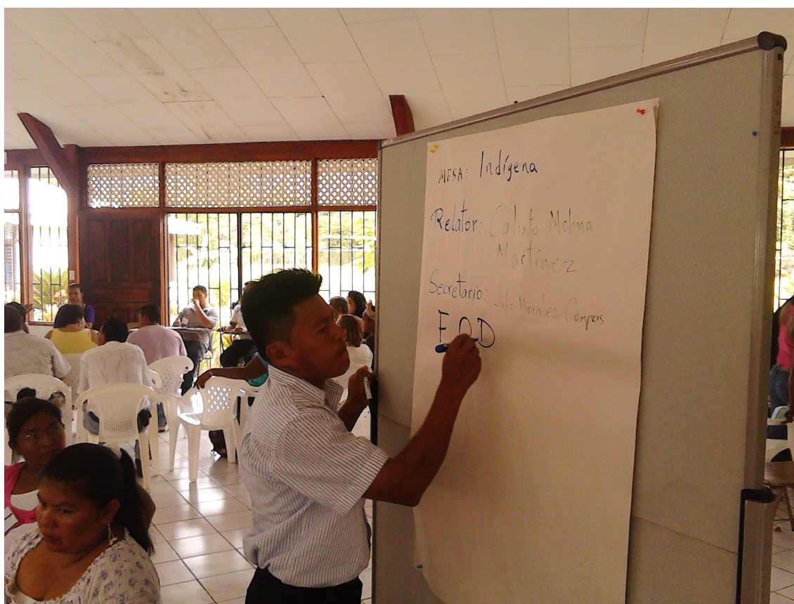
Foto 7. Talamanca-Valle de la Estrella: trabajo en la Mesa Indígena

De todas formas, se señala que – en el marco de la aplicación de la Ley 9036 – los espacios de articulación entre políticas locales y nacionales (sub-nacionales) deberán ser necesariamente los Consejos Regionales de Desarrollo Rural (CRDR), que se instituyen junto con los CTDR y que deberán operar a nivel regional.