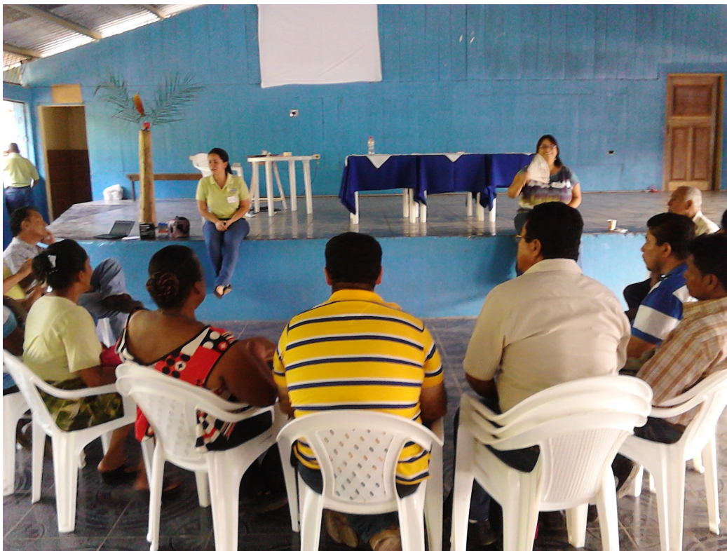
Foto 6. Talamanca-Valle de la Estrella: primera reunión del Comité Directivo de la OLDER

Lección aprendida 9: en territorios que están empezando un proceso de desarrollo rural, es importante presentar experiencias previas del mismo país o de realidades semejantes, con el objetivo de presentar y transferir al equipo técnico y a los actores del territorio buenas prácticas que puedan servir como referencia a lo largo del proceso. A este respecto, sería recomendable sistematizar la experiencia de Talamanca-Valle de la Estrella para que sirva de guía para los otros territorios rurales que se están constituyendo en Costa Rica.