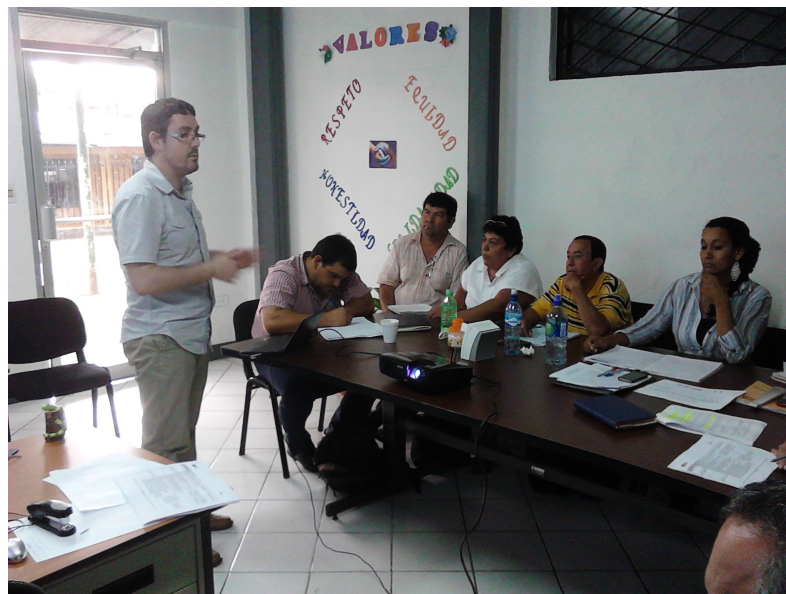
Foto 5. Sur-Sur: taller de capacitación con la Junta Directiva del GAT Sur-Bajo