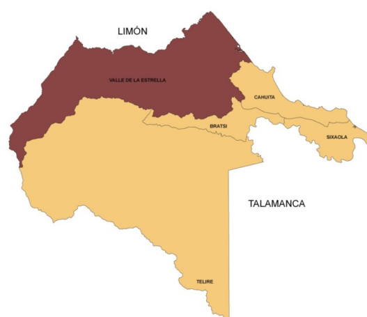
Mapa 1. Organización administrativa del territorio de Talamanca-Valle de la Estrella

La extensión del territorio es de 4042,86 Km 2 , con una población total de 48.620 habitantes, siendo 24.847 hombres y 23.773 mujeres (INEC, 2011). La población del territorio es diversa, albergando a los pueblos indígenas Bribri y Cabecar (en cinco reservas indígenas), comunidades de afro-descendientes, mestizos, migrantes europeos y de todo el continente americano principalmente nicaragüenses.