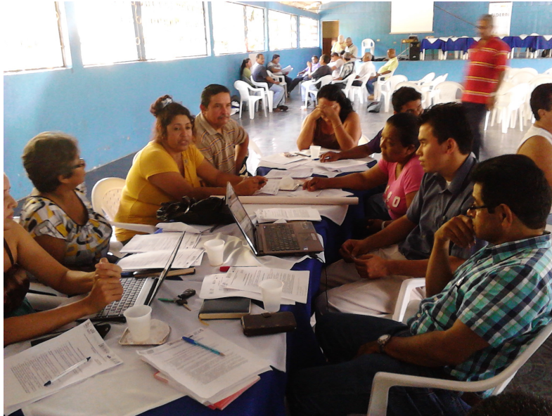
Foto 4. Tamanca-Valle de la Estrella: trabajo en las Mesas temáticas para la elaboración del PEDER.

En el diagnóstico sobre el funcionamiento de las dos organizaciones (véase el apartado IV.1) se detectó la falta en los Planes estratégicos de criterios para la selección y priorización de proyectos de desarrollo e indicadores para el seguimiento y evaluación del desempeño de cada Plan. Por este motivo, en el marco de las capacitaciones realizadas con los Gerentes y Juntas Directivas de ambos GAT (véase el apartado IV.1), se ha definido una propuesta de criterios de priorización y otra de indicadores de resultados e impacto para la evaluación del PEDER.