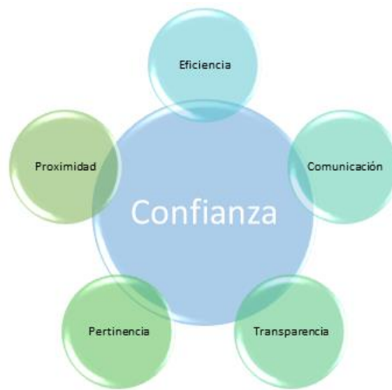
Figura 2. Principales aspectos en la generación de relaciones de confianza

La confianza que se construye con las diferentes organizaciones donantes puede tomar meses o años en consolidarse y requiere acciones permanentes para su sostenibilidad, pero si ésta es la correcta, generará el reconocimiento del Instituto, el cual se deberá de seguir nutriendo mediante la capacidad técnica y financiera, la eficacia y el cumplimiento de los compromisos asumidos. Por otra parte, con tan solo una acción malograda, la confianza puede ser castigada, afectando la vinculación futura con este y otros donantes.