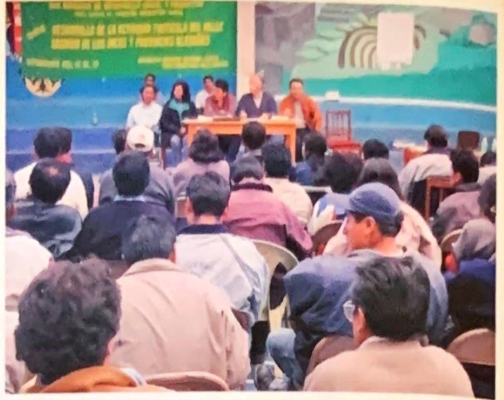
Reunión con representantes de los productores del Valle Sagrado de Los Incas y Zonas Aledañas - Región Cusco.

El Taller de trabajo en la ciudad de Urubamba se realizó con la participación de representantes de los productores agrarios de los distritos del Valle Sagrado de los Incas y Zonas Aledañas, representantes de la gerencia regional de planificación, representantes de la Universidad Nacional San Antonio Abad del Cusco (Facultad de Agronomía), del INIA, del Servicio Nacional de Sanidad Agraria (SENASA), de la (Agencia Agraria Urubamba, del Asesor del Gobierno Regional, del Programa Nacional de Manejo de Cuencas Hidrográfica y Conservación de Suelos, PRONAMACHCS.