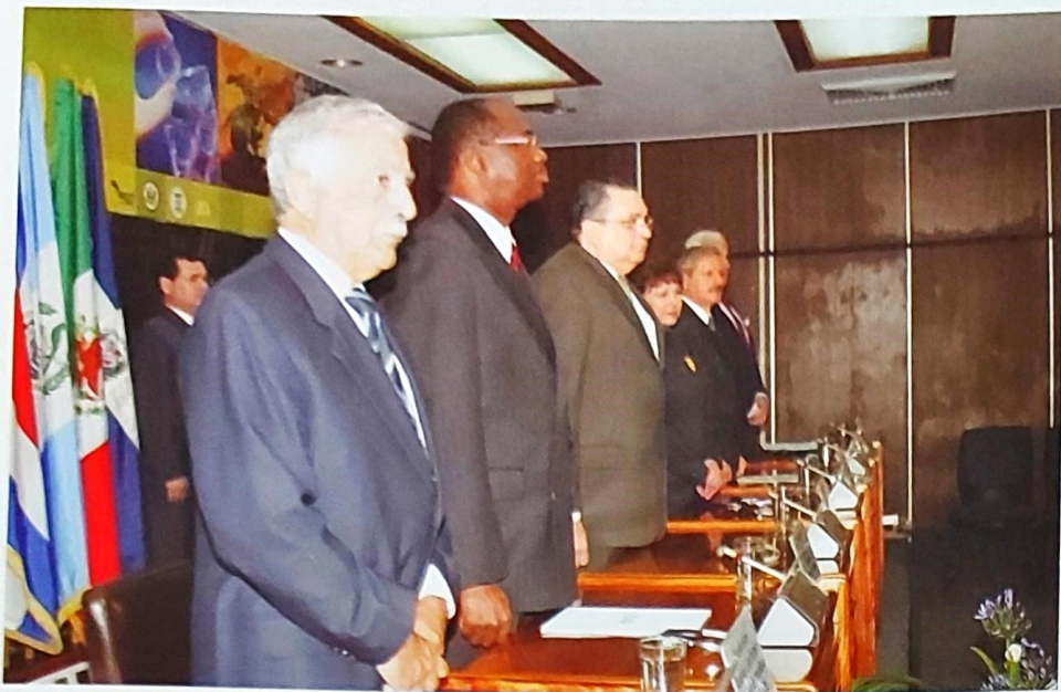
El Presidente de la República de Costa Rica, Abel Pacheco, inauguró la Conferencia Ministerial.