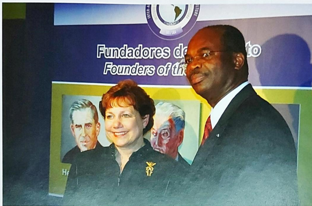
La visión de Henry Wallace fue recordada durante la inauguración de la Galería Histórica.

La Secretaria de Agricultura de los EE.UU. y el Director General inauguraron la Galería Histórica del Instituto.