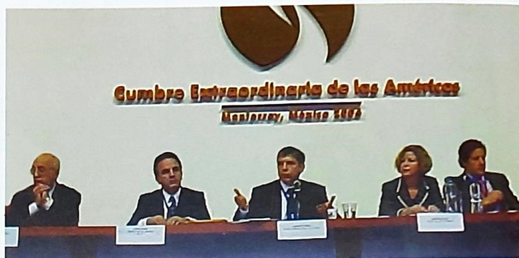
El Informe de Cumbres 2001-2003 "Avanzando en las Américas: Procesos y Desafíos", preparado por la Secretaría de Cumbres de las Américas, reconoce la labor del IICA en este proceso.

Al resumir los principales logros en la implementación de los mandatos de la III Cumbre de las Américas (Quebec, 2001) en la gestión agrícola y desarrollo rural, resaltó la movilización efectiva de los ministros del ramo para implementar los objetivos de las Cumbres a través de reuniones ministeriales a nivel hemisférico y el apoyo técnico del IICA.