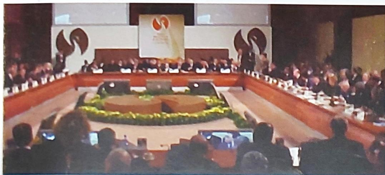
En la Declaración de Nuevo León, los jefes de Estado y de Gobierno del hemisferio dieron su apoyo a la aplicación del Plan de Acción AGRO 2003-2015

Destaca la reingeniería realizada por el Instituto para comprometerse con el proceso, la movilización efectiva de los ministros de agricultura y el apoyo técnico otorgado.