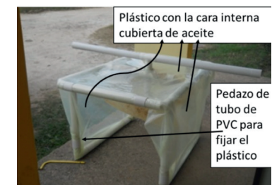
Fig. 9. Hoja de plástico colgando, que al rozar las hojas, asusta a los insectos provocando el vuelo.