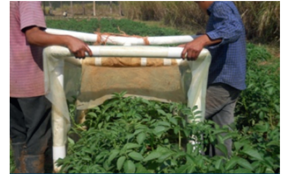
Fig. 7. Trampa pegante móvil para captura de adultos de la mosca minadora.