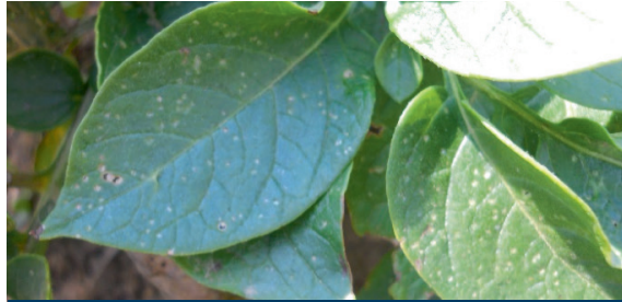
Fig. 1. Pústulas blancas ocasionadas por los adultos.

La mosca minadora es un insecto que se alimenta y reproduce en muchas plantas, incluyendo la papa. En su estado adulto es una pequeña mosca que se le encuentra reposando sobre las hojas. Causa daño a las plantas porque en sus estados larval y adulto se alimenta succionando savia o haciendo galerías en el interior de las hojas ocasionando la pérdida de área fotosintética.