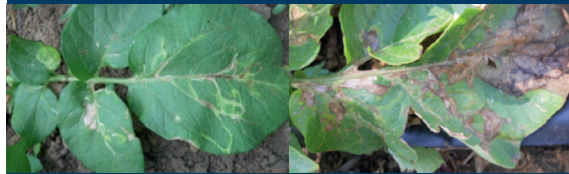
Fig. 2. Daño ocasionado por la mosca minadora a hojas de plantas de papa.