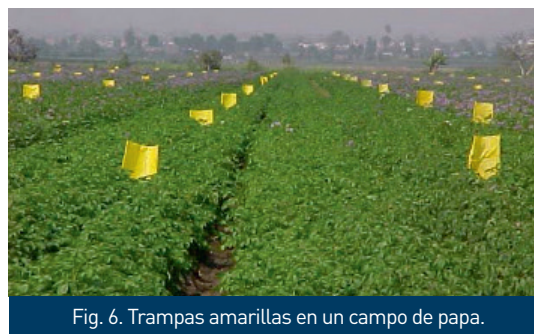
Fig. 6. Trampas amarillas en un campo de papa.

Cuando se detecta una población de dos adultos por cada 40 metros de hilera se recomienda usar la trampa pegante móvil. Al pasar esta herramienta por encima del follaje del cultivo permite un control efectivo de los adultos de la mosca minadora.