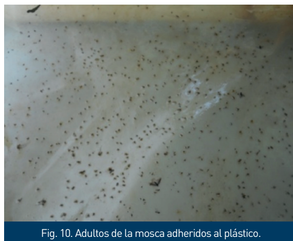
Fig. 10. Adultos de la mosca adheridos al plástico.

La trampa debe ser pasada todas las veces que sea necesario hasta que ya no haya capturas del insecto. Una vez que el plástico pegajoso se satura de insectos, este debe ser lavado para impregnarlo de aceite nuevamente y seguir pasando la trampa.