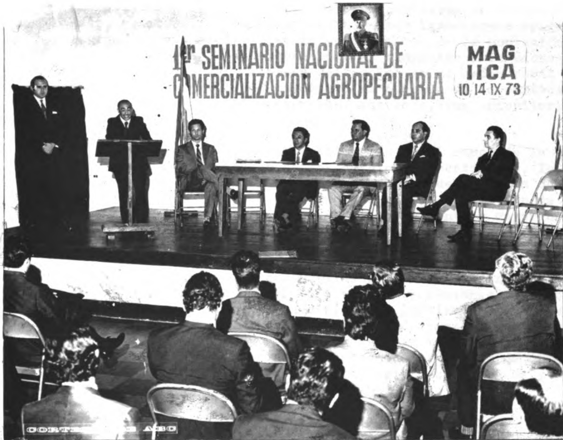
Organizado por el Ministerio de Agricultura y Ganadería a través de su dirección de Comercialización, y el Instituto Interamericano de Ciencias Agrícolas —IICA— se realizó el primer Seminario Nacional sobre Comercialización Agropecuaria.