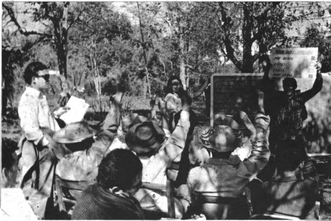
El Servicio de Extensión Agrícola Ganadera del Ministerio de Agricultura y Ganadería realiza la planificación del trabajo de extensión a nivel local, con la participación de los campesinos. En esta labor han recibido orientación del Instituto Interamericano de Ciencias Agrícolas — IICA—.