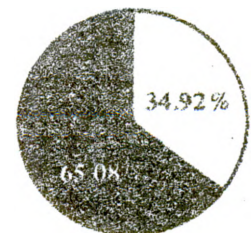
Porcentaje de monto del capital