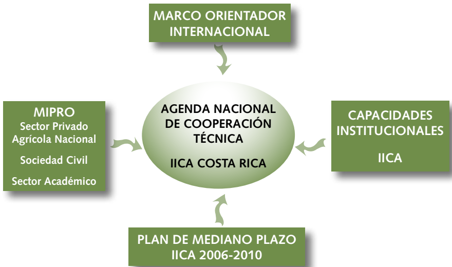
Gráfico 1. Componentes del Marco Orientador para la Agenda Nacional de Costa Rica 2006-2010

Para la Agenda Nacional de Cooperación Técnica en Costa Rica, la consulta fue un proceso que partió desde ciertos aspectos generales que sirvieron como marco orientador, hacia aspectos específicos que delimitaron la cooperación técnica en función de demandas y capacidades. El proceso de consulta contó con cuatro factores retroalimentadores que fueron: (i) Marco Orientador Internacional; (ii) Plan de Mediano Plazo del IICA 2006-2010; (iii) Sector Público Agropecuario, representado por el Ministerio rector del sector agropecuario (MIPRO), el sector privado agropecuario, las cámaras, asociaciones, grupos organizados representantes de la sociedad civil y de la academia; (iv) las capacidades institucionales del IICA. (Gráfico 1)