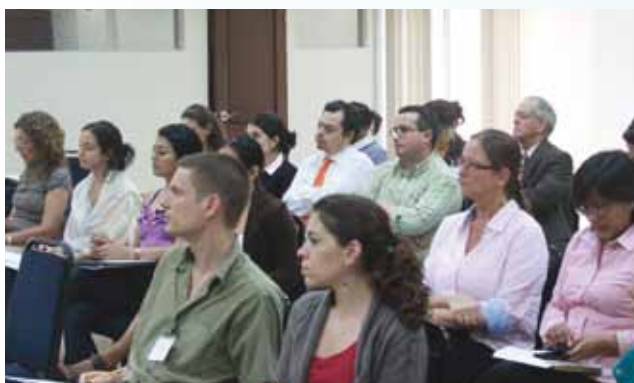
El foro se efectuó en la Sede Central del IICA, en San José de Costa Rica, y se transmitió vía web a varios países en América Latina y el Caribe.