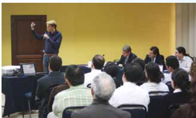
En el foro técnico, Läderach explicó que la alta vulnerabilidad de algunos cultivos ante el cambio climático en Centroamérica podría poner en riesgo la seguridad alimentaria de pequeños productores y sus familias.