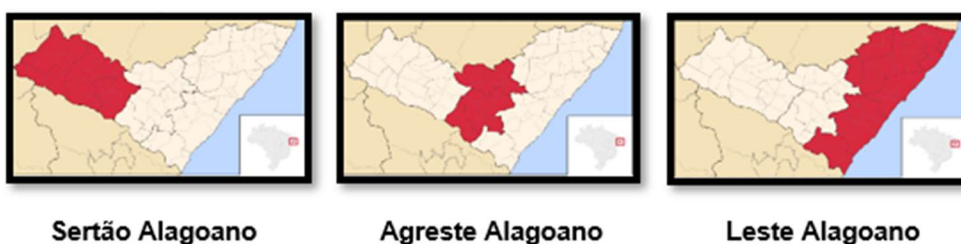
Figura 1. Distribuição geográfica das mesorregiões de Alagoas.

A Figura 1 apresenta a localização geográfica das três mesorregiões de Alagoas.