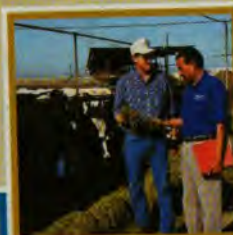
Interacción con el Sector Privado