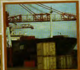
Acceso a Mercados

Servicios Nacionales de Sanidad Agropecuaria e Inocuidad de Alimentos