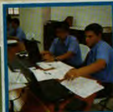
Capital humano y financiero