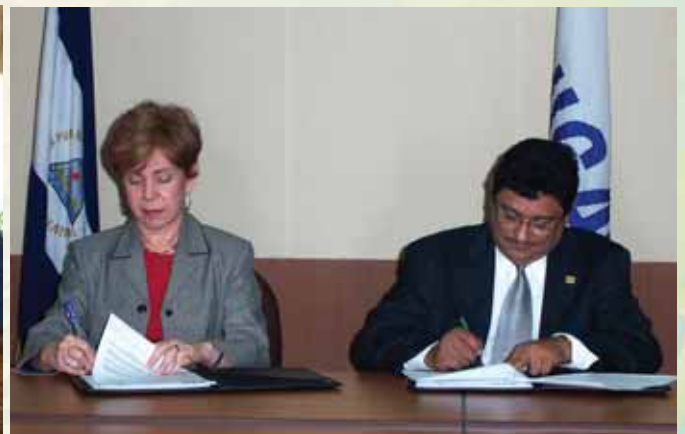
Convenio de Cooperación IICA-MIFIC.