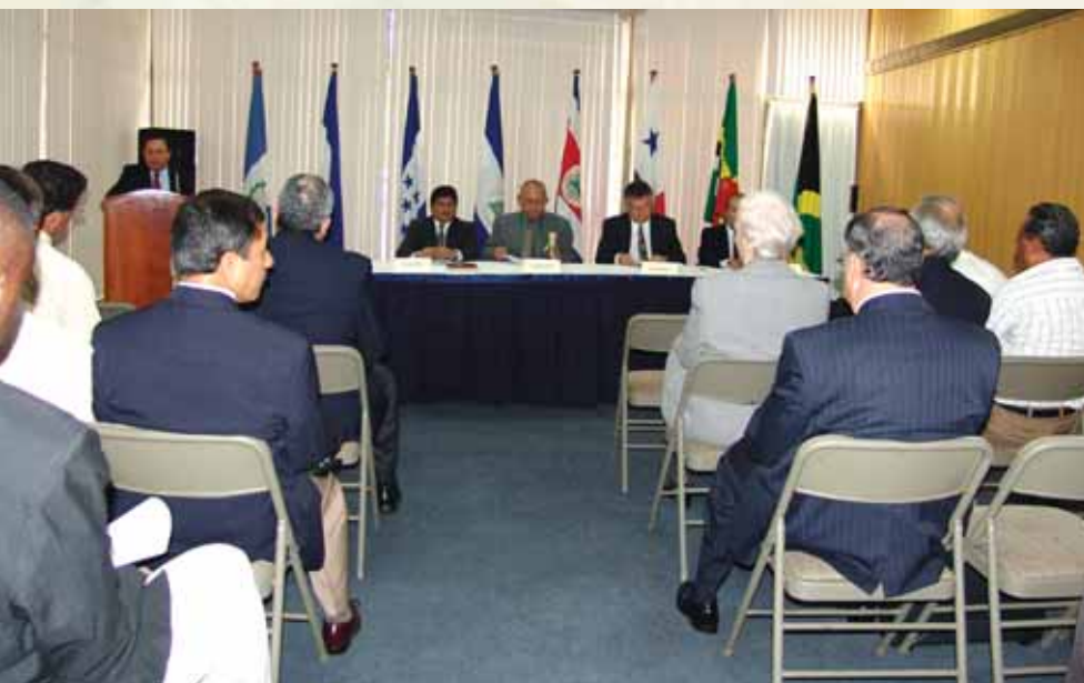
Reunión ordinaria del Consejo Directivo de PROMECAFE.

Sus acciones se complementaron con la realización de eventos, reuniones, talleres, seminarios y encuentros en diferentes plazas del territorio nacional y para sectores diversos del agro nicaragüense e implicó la participación de decenas de hombres y mujeres, así como también se brindó seguimiento y supervisión a 30 eventos de capacitación de proyectos en ejecución.