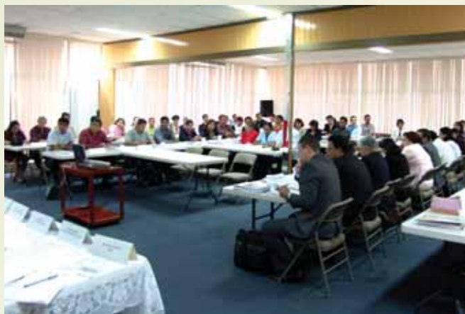
Al foro latinoamericano asistieron 70 especialistas de 13 países, durante los días 30 de noviembre al 2 de diciembre.