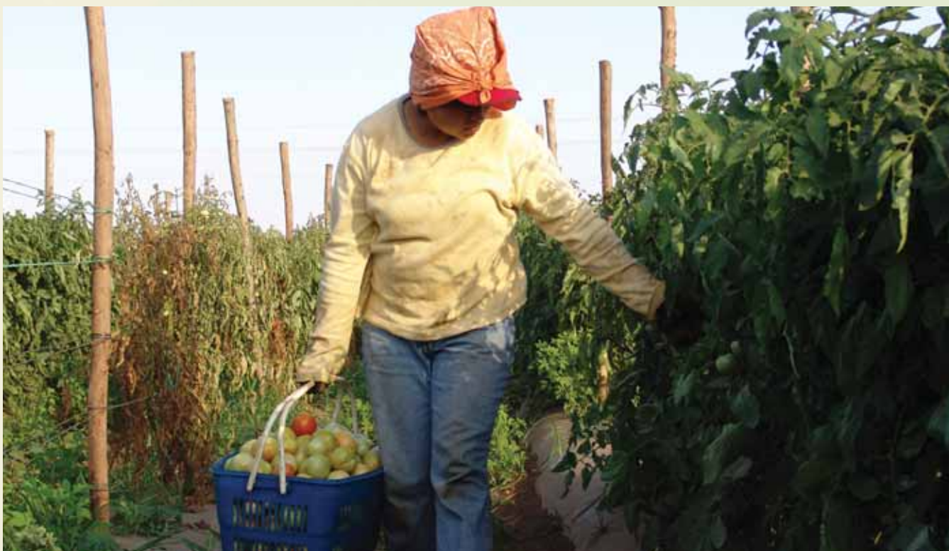
PRORURAL comenzó con la identificación de necesidades de asistencia técnica.

de Desarrollo Rural y Tecnológico, el fomento al diálogo entre donantes y Gobierno y la formulación de un programa de inversión y apoyo presupuestal plurianual para el desarrollo del agro y el medio rural (PRORURAL).