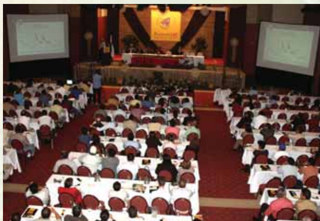
Con apoyo del IICA, los cafetaleros nicaragüenses realizaron por quinta vez el Encuentro Internacional RAMACAFE en Managua, el 18 y 19 de septiembre. El evento contó con la asistencia de 339 especialistas de todo el mundo.