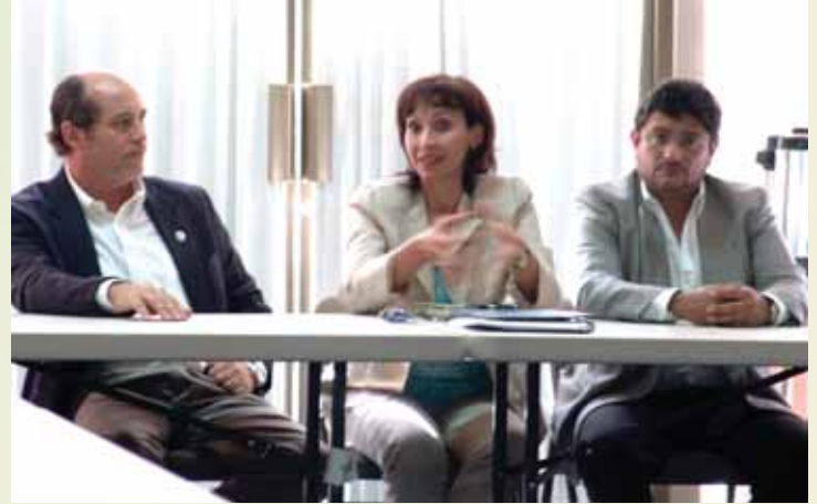
Convenio de Cooperación OEA-OPS-IICA.

tegias, programas y proyectos, así como brindar asesorías y apoyo técnico y logístico para la formulación y gestión de proyectos de inversión y estudios para el desarrollo rural y el agro nicaragüense.