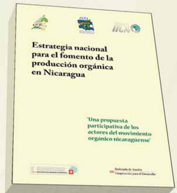
Cussianovich, Pedro et al: 2005 Estrategia Nacional para el Fomento de la Producción Orgánica en Nicaragua . Ed IICA 135 p.