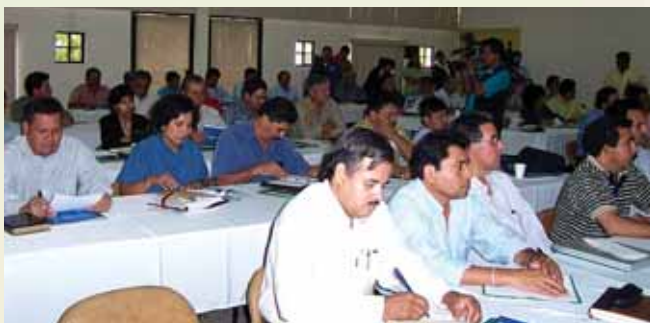
El evento “Capacitación de Facilitadores, Producir para Prosperar”, fue organizado por el IICA-CCAA-AID. Asistieron 60 capacitadores de cinco países centroamericanos, el pasado 30 y 31 de marzo.