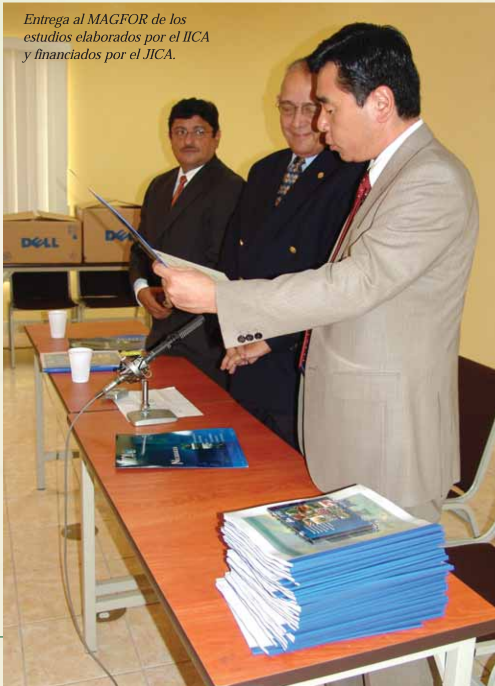
Entrega al MAGFOR de los estudios elaborados por el IICA y financiados por el JICA.

estrategia general y por producto para incrementar la capacidad agro exportadora del país, y sustitutiva de importaciones, mediante la identificación de oportunidades de mercado, contactos comerciales y ficha por producto a través del sondeo de mercados en 8 países; la identificación de factores clave de éxito y limitantes a la competitividad existentes a nivel macro, territorial y micro empresarial en el territorio nacional, y la realización de 16 estudios de cadenas agro-productivas.