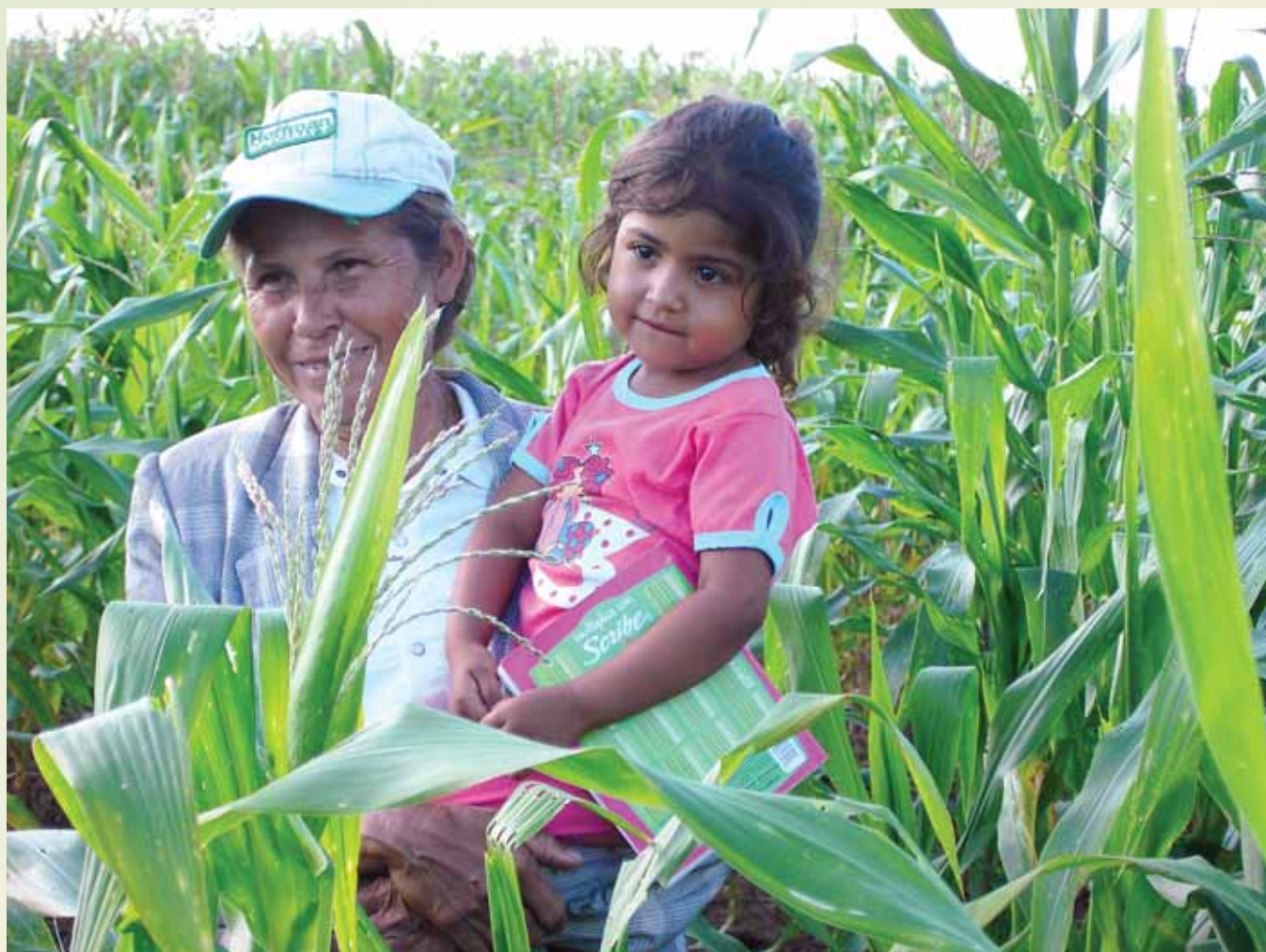
Capacitación a las agricultoras, una de las más importantes acciones del IICA en 2005.

se concluyó el apoyo para esta última institución, incorporando una función normativa y reguladora que permitirá certificar a las empresas privadas de asistencia técnica.