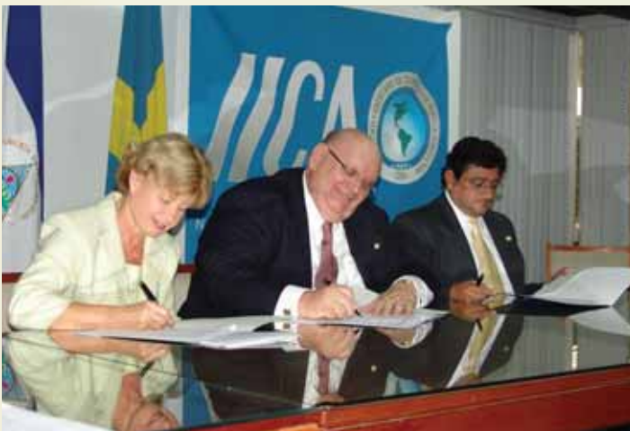
Convenio de Cooperación Gobierno de Finlandia - IICA.