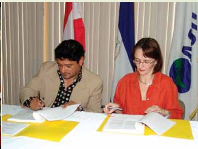
Convenio de Cooperación IICA-Gobierno de Austria.

El IICA Nicaragua ha desarrollado una sólida política de creación de alianzas con otras agencias internacionales y regionales y con organizaciones públicas y privadas.