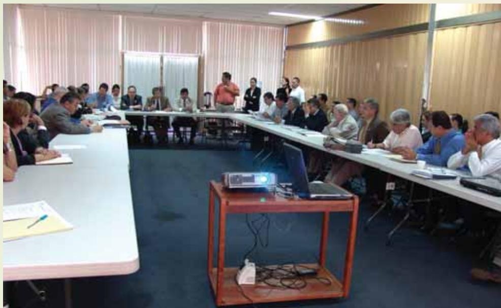
Reunión del personal técnico y administrativo de la Oficina del IICA Nicaragua con representantes de las oficinas del IICA en América Central.