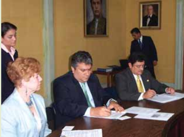
Convenio de Cooperación MIFIC-MINREX-IICA.