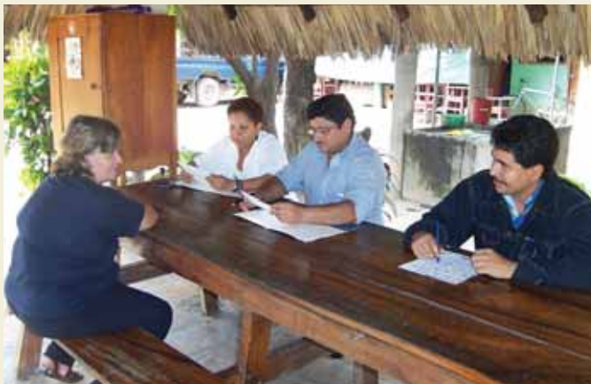
Convenio de Cooperación IICA-Xochilt Acalt.