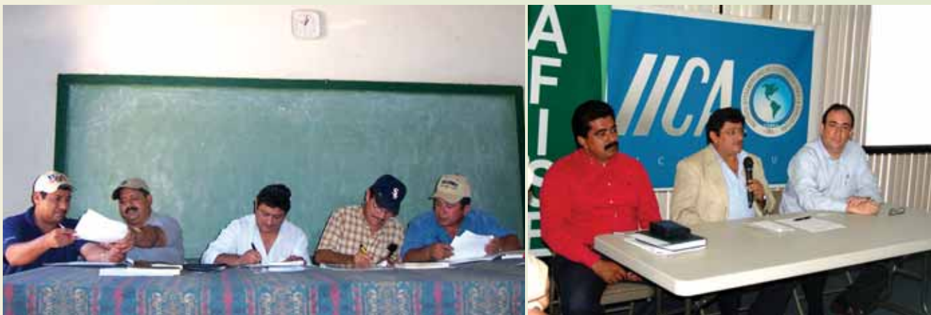
Convenio de Cooperación IICA-Alcaldías de Los Cuatro Santos (Chinandega). Convenio de Cooperación IICA-LAFISE.