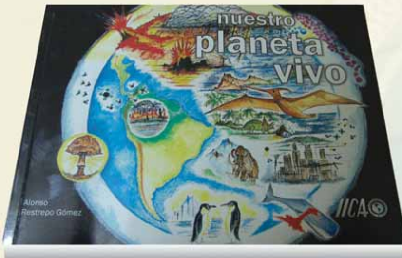
Restrepo, Alonso. 2005 nuestro planeta vivo . Ed. Restrepoeditores/IICA 60p.