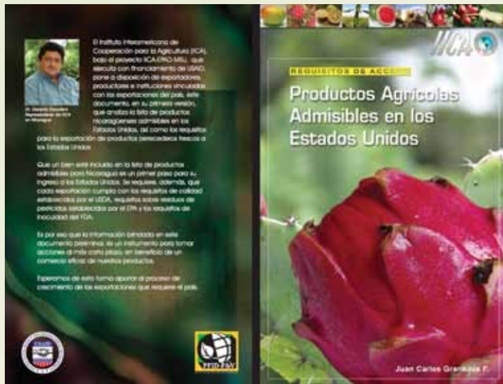
Granados, JC 2005 Requisitos de acceso: Productos agrícolas admisibles en los Estados Unidos de Norteamérica . Ed IICA 100 p.