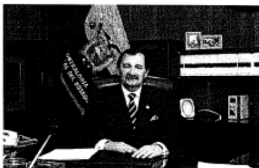
Carlos Pólit Faggioni