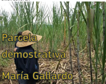
Parcela demostrativa María Gallardo