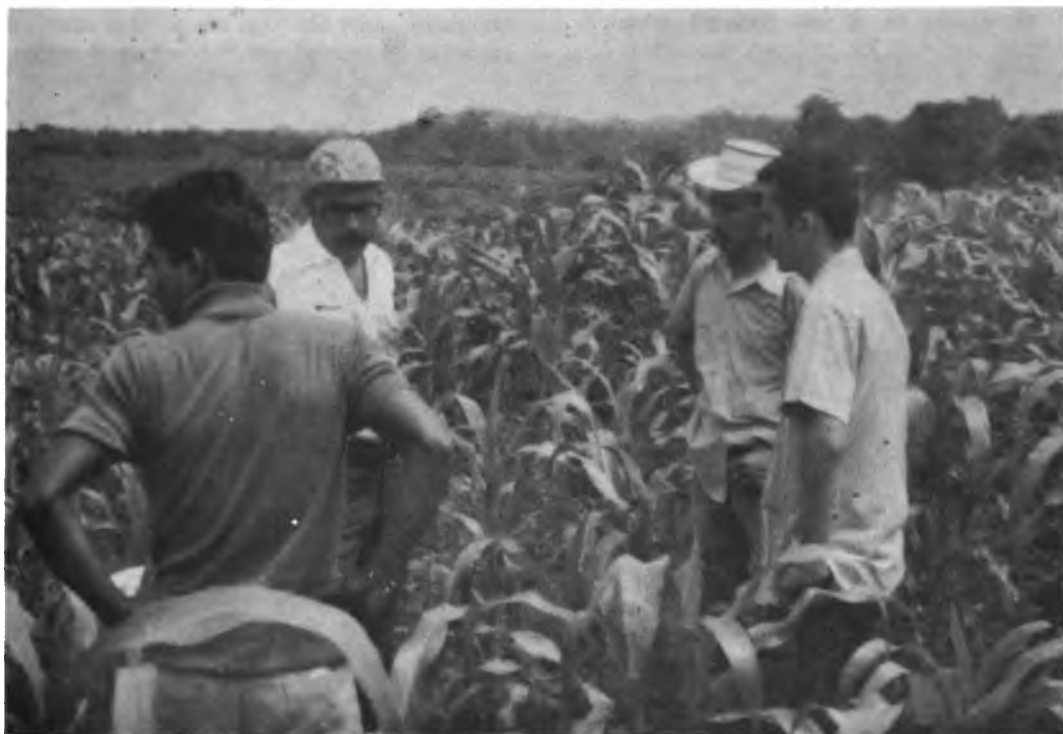
REUNION CENTROAMERICANA DE DIRIGENTES DE EMPRESAS COMUNITARIAS CAMPESINAS – PANAMA. Los Participantes tuvieron oportunidad de visitar los cultivos de los asentamientos campesinos de Panamá, durante la visita que se realizó al campo.