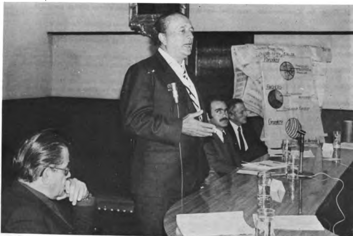
CONFERENCIAS DE REFORMA AGRARIA EN LA ASAMBLEA LEGISLATIVA DE COSTA RICA. El señor Hernán Garrón Salazar, Ministro de Agricultura, participó en el Panel que se organizó como parte del Ciclo de Conferencias.