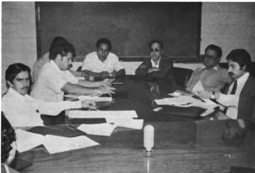
SEMINARIO DE REFORMA AGRARIA PARA LA U. D. E. M. A. G. — Los participantes en el Seminario discutieron en grupos de trabajo el contenido de las conferencias y Documentos de estudio que sirvieron de base al Seminario. Al final emitieron sus conclusiones.