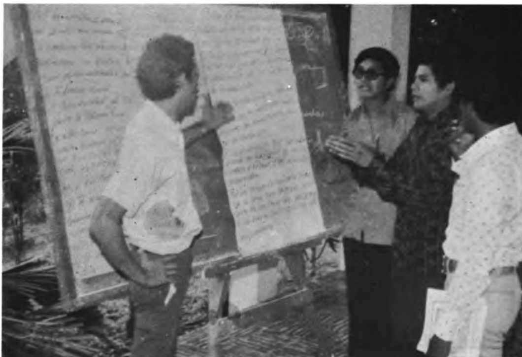
SEMINARIO DE ADMINISTRACION RURAL – IAN, NICARAGUA. Al final de esta actividad los participantes expusieron las conclusiones de su trabajo.