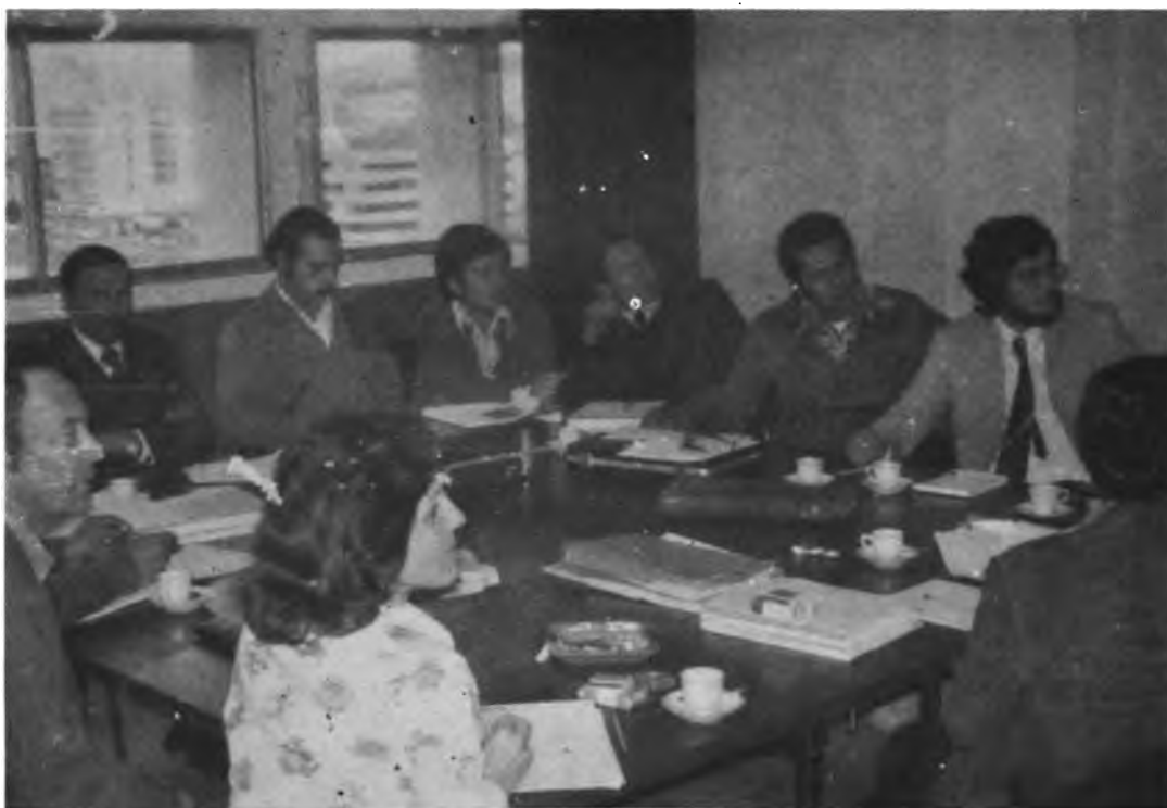
REUNION SOBRE INVESTIGACION APLICADA A EMPRESAS COMUNITARIAS CAMPESINAS. Un grupo técnico del IICA y de los Organismos Nacionales de Reforma Agraria e Investigación en Reforma Agraria de Honduras, Costa Rica, Panamá, Venezuela, Colombia y Perú, se reunió en Lima, Perú para analizar la metodología de la investigación en este campo.