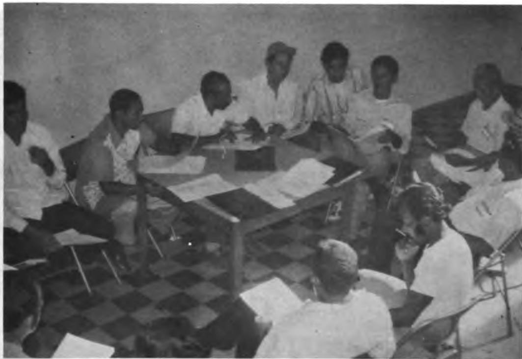
REUNION CENTROAMERICANA DE DIRIGENTES DE EMPRESAS COMUNITARIAS CAMPESINAS – PANAMA. Uno de los grupos de trabajo que se integraron, discute los aspectos conceptuales y las experiencias de las empresas campesinas de sus países.