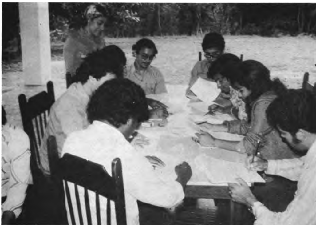
SEMINARIO DE ADMINISTRACION RURAL – IAN, NICARAGUA. Los participantes discutieron en grupos de trabajo los resultados de la encuesta que se realizó en las Colonias "San Pedro" y "El Tepeyac", como parte del Seminario.