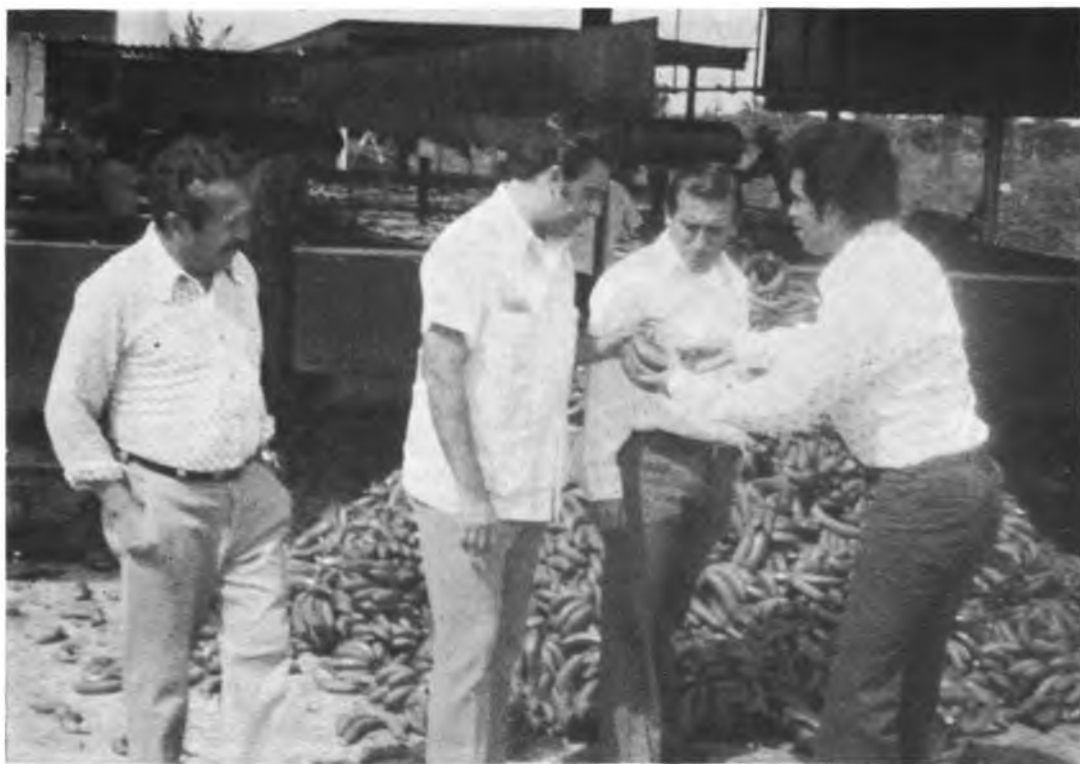
VISTA AL PLAN CHONTALPA – MEXICO. En uno de los Ejidos Colectivos del Plan Chontalpa, los participantes visitan una de las plantas empacadoras de banana.