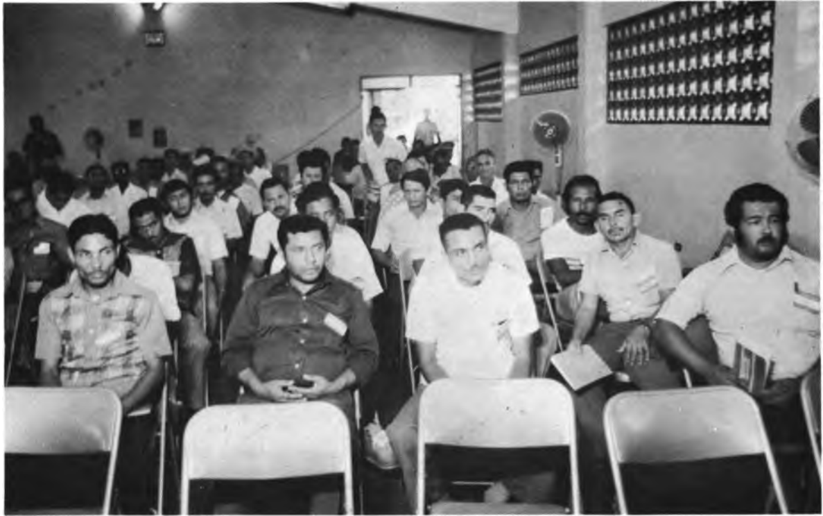
REUNION CENTROAMERICANA DE DIRIGENTES DE EMPRESAS COMUNITARIAS CAMPESINAS – PANAMA. A la reunión asistieron 30 delegados campesinos de ANACH y FECORAH de Honduras que aparecen en esta fotografía, durante una de las conferencias.