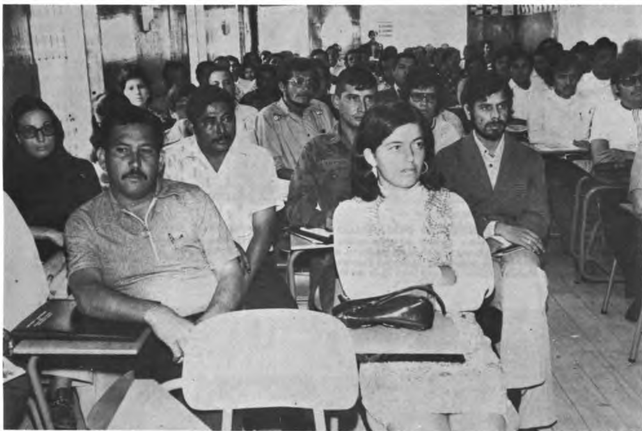
CURSOS PARA TECNICOS EN DESARROLLO AGRARIO – HONDURAS. Vista de la Concurrencia y alumnos asistentes al Curso durante el Acto Inaugural.