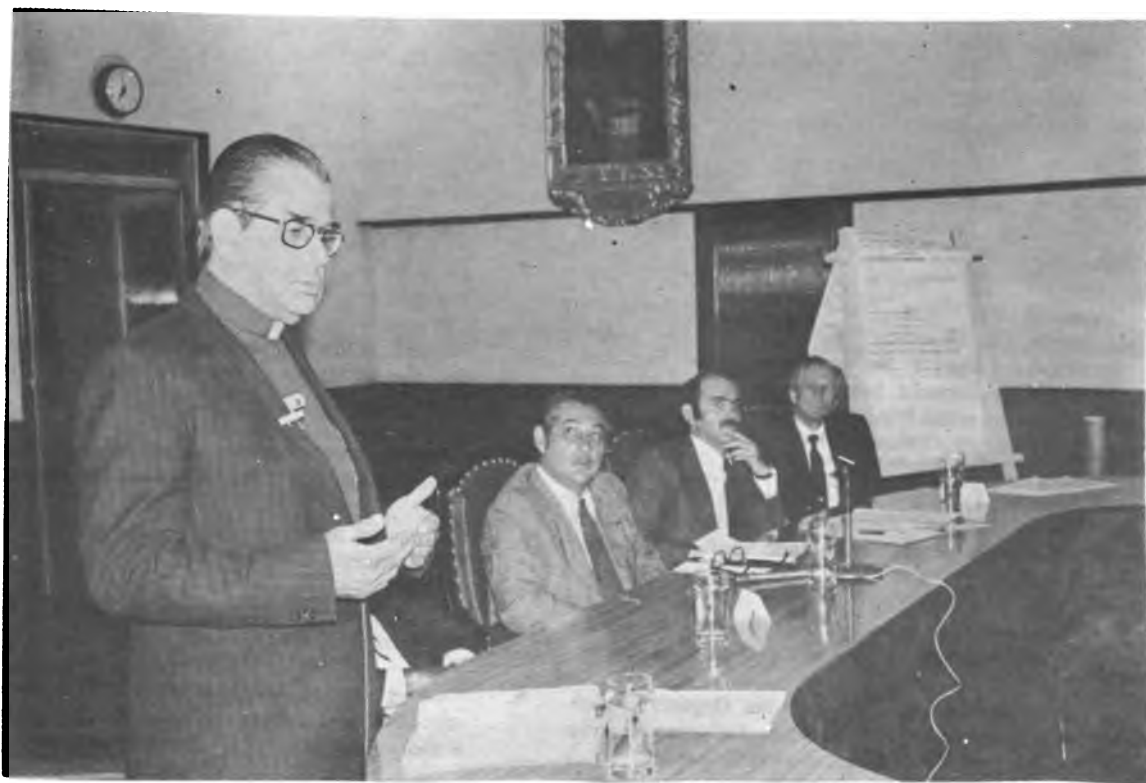
CONFERENCIAS DE REFORMA AGRARIA EN LA ASAMBLEA LEGISLATIVA DE COSTA RICA. El Pbro. Benjamín Núñez, Rector de la Universidad Nacional Autónoma, tuvo a su cargo una disertación durante el Panel que se desarrolló en esa oportunidad.