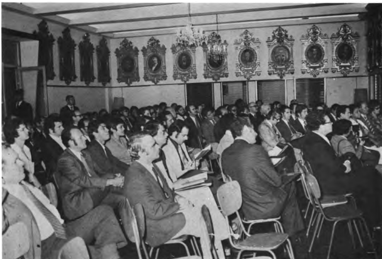
CONFERENCIAS DE REFORMA AGRARIA EN LA ASAMBLEA LEGISLATIVA DE COSTA RICA. Vista parcial de los asistentes a las conferencias en el Salón de Expresidentes de la Asamblea.