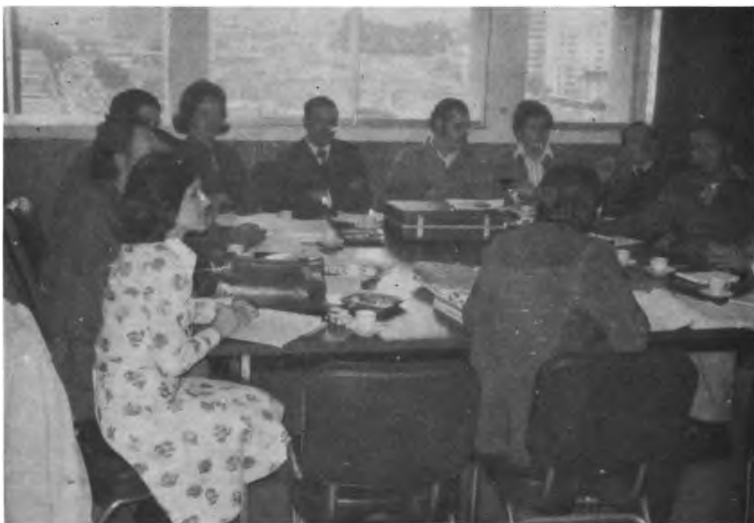
REUNION SOBRE INVESTIGACION APLICADA A EMPRESAS COMUNITARIAS CAMPESINAS. Un grupo técnico del IICA y de los Organismos Nacionales de Reforma Agraria e Investigación en Reforma Agraria de Honduras, Costa Rica, Panamá, Venezuela, Colombia y Perú, se reunió en Lima, Perú para analizar la metodología de la investigación en este campo.