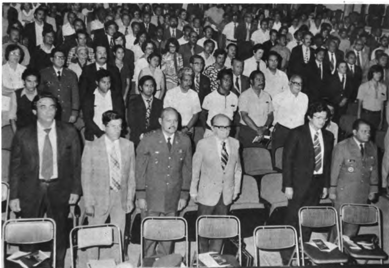
SEMANA AGRARIA HONDUREÑA. Vista parcial de los asistentes al Acto Inaugural. Destacan en primera fila, altos funcionarios civiles y militares del Gobierno de Honduras. Al Ciclo de Conferencias asistió un promedio mayor de 500 personas durante todos los días de la Semana. Las Conferencias fueron transmitidas por Radio América y HRN de Honduras.