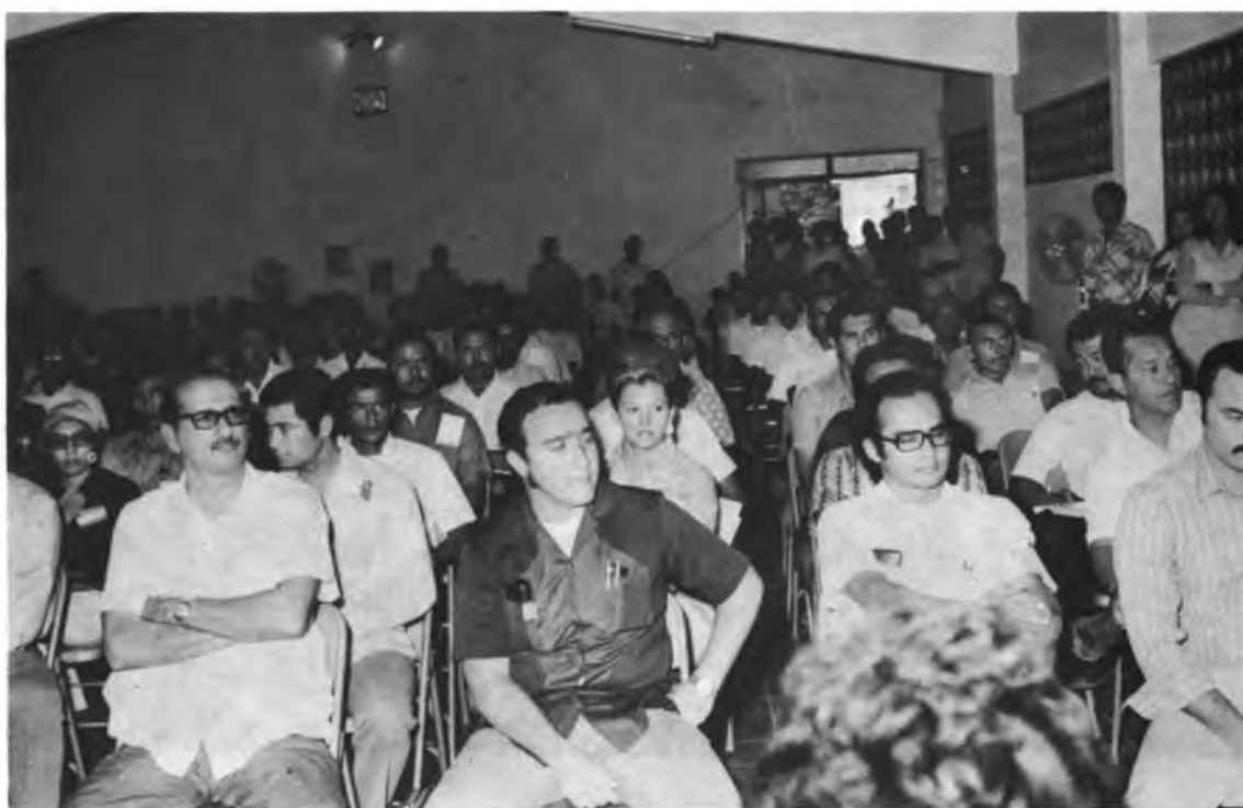
REUNION CENTROAMERICANA DE DIRIGENTES DE EMPRESAS COMUNITARIAS CAMPESINAS – PANAMA. Vista general de los asistentes al Acto Inaugural.