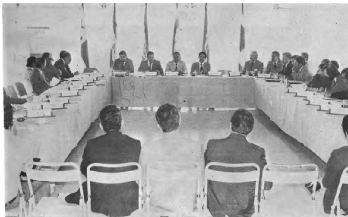
IX REUNION DE EJECUTIVOS DE REFORMA AGRARIA DEL ISTMO CENTROAMERICANO – GUATEMALA. Vista general de una de las reuniones de trabajo.