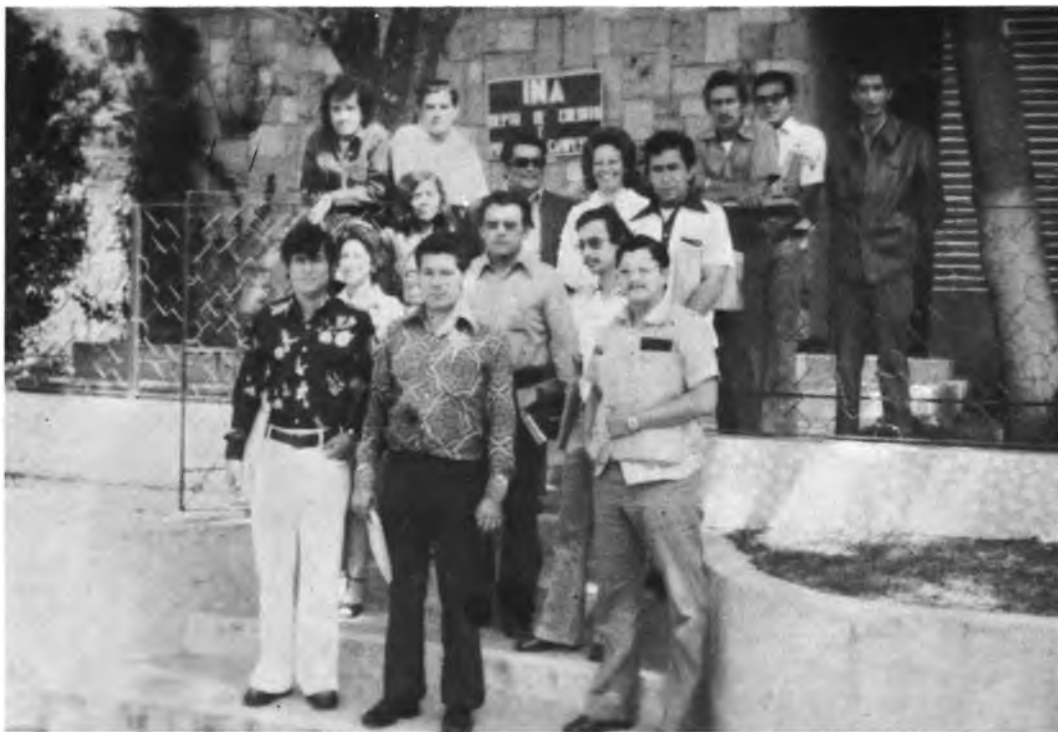
VISITA AL PROGRAMA DE ORGANIZACION Y CAPACITACION CAMPESINA DE HONDURAS. Un grupo de 15 funcionarios del IAN de Nicaragua realizaron una visita a Honduras para conocer el Programa de Organización y Capacitación Campesina de ese país.