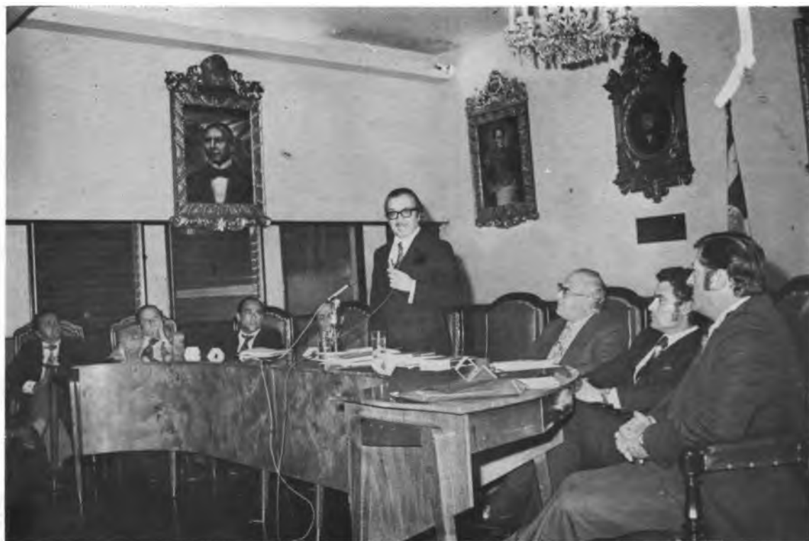
CONFERENCIAS DE REFORMA AGRARIA EN LA ASAMBLEA LEGISLATIVA DE COSTA RICA. El Dr. Alfonso Carro Zúñiga, Presidente de la Asamblea, se dirige a la concurrencia durante el Acto Inaugural del Ciclo de Conferencias.