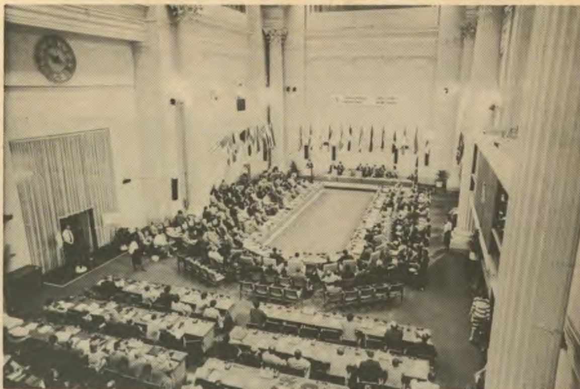
Sesión Inaugural de la IX CIMA, Ottawa, Canadá, 1987.